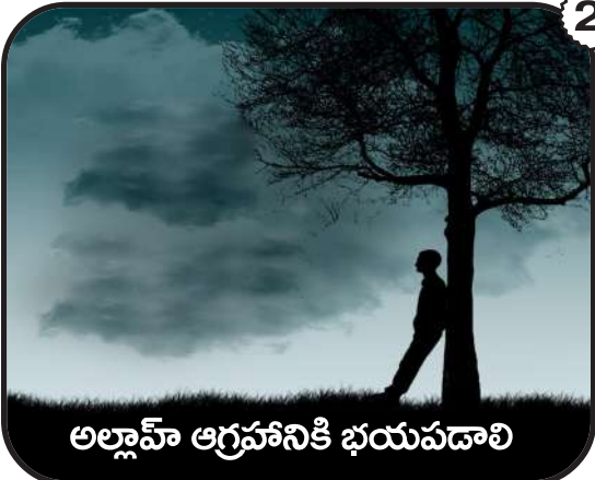
అల్లాహ్ ఆగ్రహానికి భయపడాలి

Edited, Printed & Published by S.M. Mallick on behalf of Telugu Islamic Publications, Typeset at "Geeturai Graphics", Printed at Cosmic Printers, Lakkadkot, Hyderabad-2, RNI R.No.37796/81, Postal Regn. No.HSE/422/2023-2025 Phone: 24564583. e-mail: geeturaiweekly@gmail.com