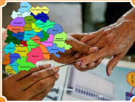
భవితను నిర్ణయించే వజ్రాయుధం: ఓటుహక్కు