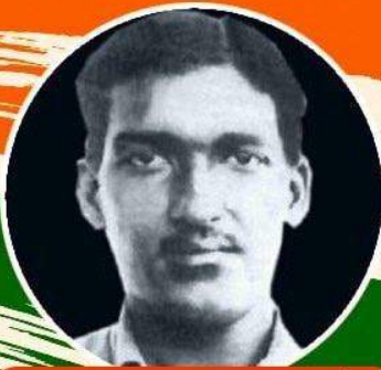
అశఫాక్ అల్లా ఖాన్