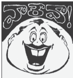
(బీజేపీ నేతలు బహిరంగంగా డబ్బుపెట్టి ఓట్లు కొంటున్నారు. - అరవింద్ కేజ్రీవార్ )

డబ్బుపెట్టి ఓట్లుకొనే కుయుక్తి భా.జ.పాది ఇంతకంటే నీచమైన సంస్కృతి మరి ఏది! అంతఖర్చు మాకేంటి ఎమ్మెల్యేలనె చీలుస్తం విపక్ష ప్రభుత్వాలను నిలుపున కూలుస్తం!! - యం.డి. ఉస్మాన్ ఖాన్